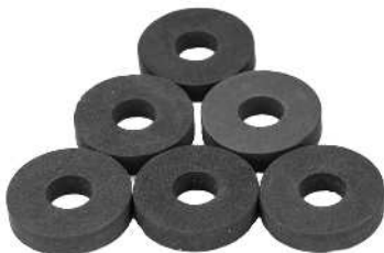
Neoprenpakninger / Tätningrings