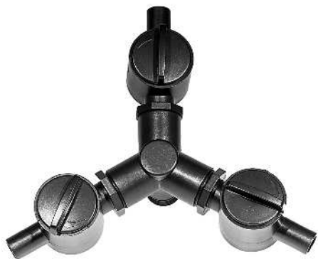
Tre-vejs fordeler / Trevägskran