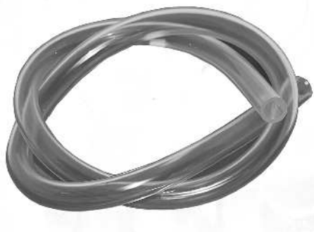
Plastslange / Plastslang