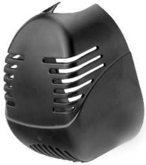
Filterdæksel / Filterkåpa