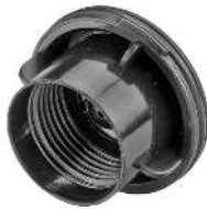
Rotorlåg / Rotorlock