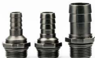
Slangekoblinger med 1" gevind til 12/16/25 mm slange. Slangkopplingar med 1" gänga till 12/16/25 mm slang.