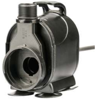
Pumpemotor / Pumpmotor