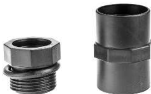
Gvindreduktionsring 1" udv/indv og 1" Muffe Gängad reduceringsring 1" utv/inv och 1" gängad invändig sockel