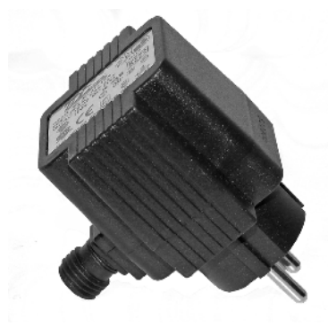
Udendørs transformator Uttomhus transformator