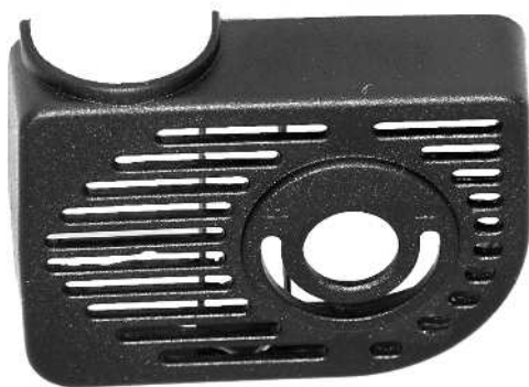
Filterhus / Filterkåpa

En defekt pumpe må ikke lægges i den normale dagrenovation, men skal indleveres på en af hjemkommunens genbrugspladser for el-materiel f.eks. en miljøstation.